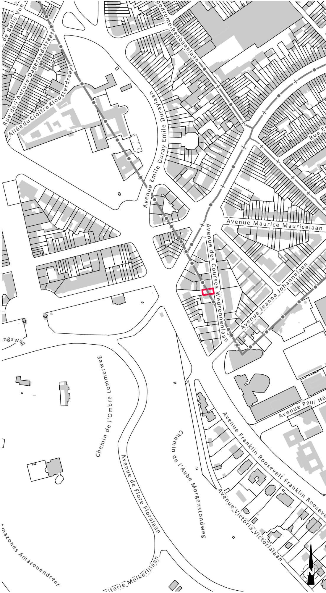
plan de localisation 1/5000